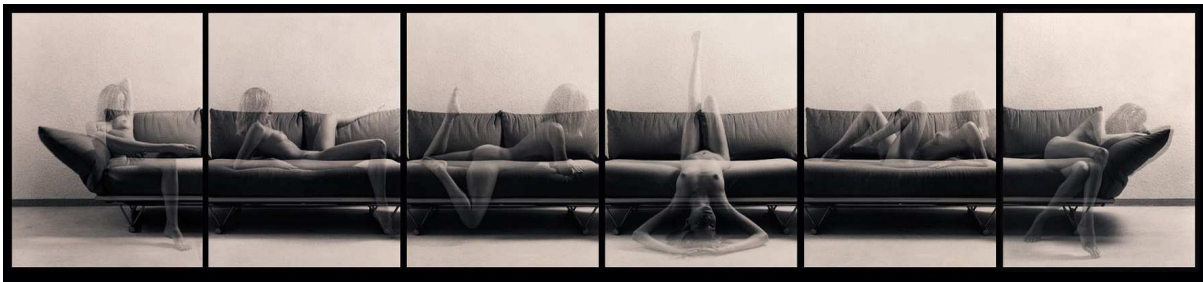
"Ausziehsofa", Serie von 6 bis 8 Silbergelantine-Abzügen, getont, je 40 x 50 cm