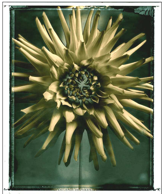
Polaroid Typ 665, Solarisation des Negativs