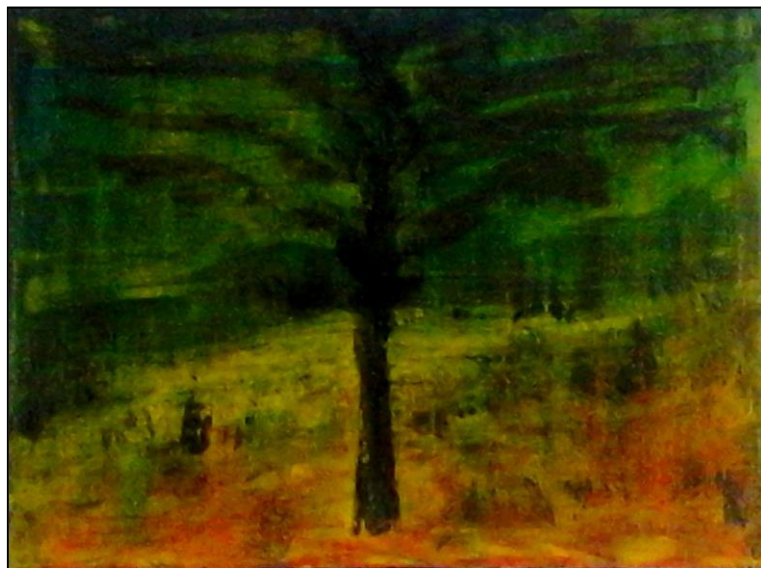
Ich habe einen Baum Acryl 2014 60 cm x 80 cm