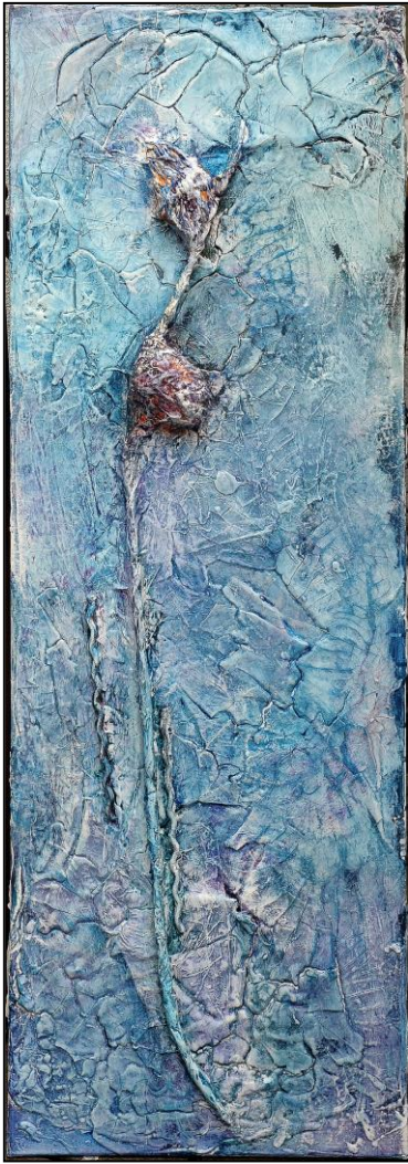
Blume des Bösen